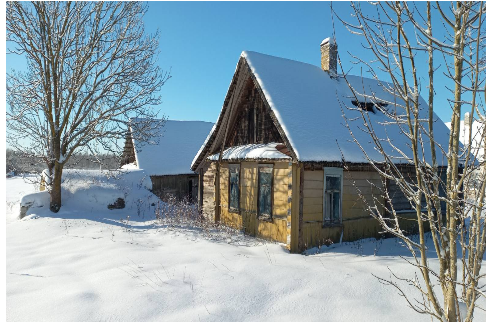
д. Ковшелево, ул. Центральная, д.44