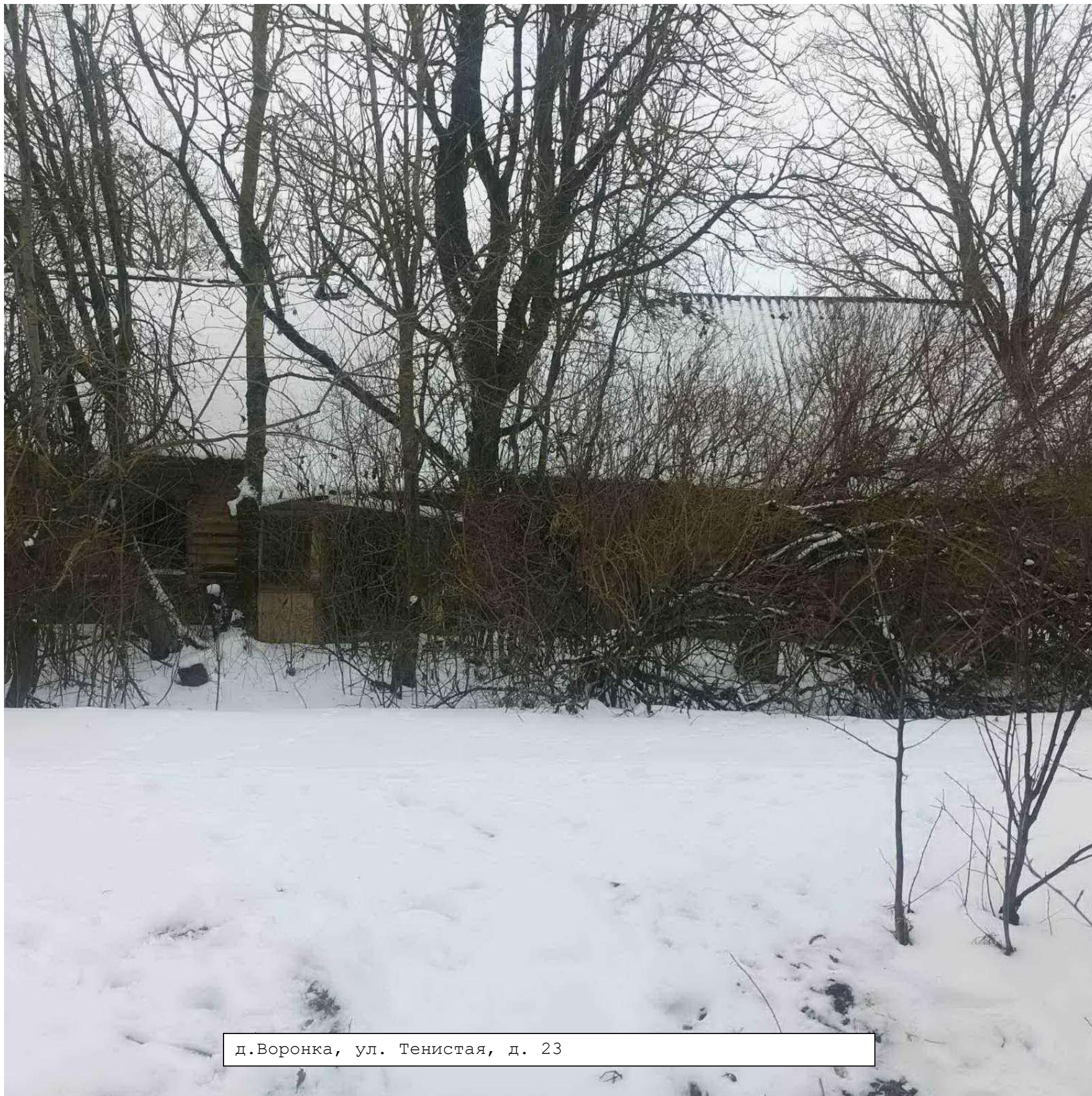
д.Воронка, ул. Тенистая, д. 23