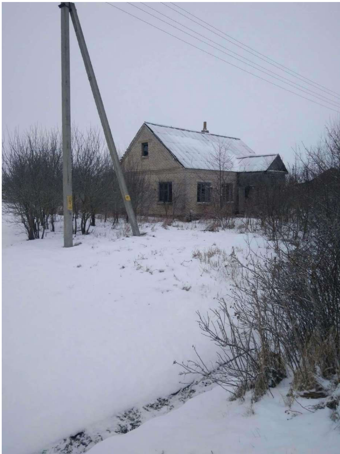
д. Болкалы, ул. Центральная, д.71