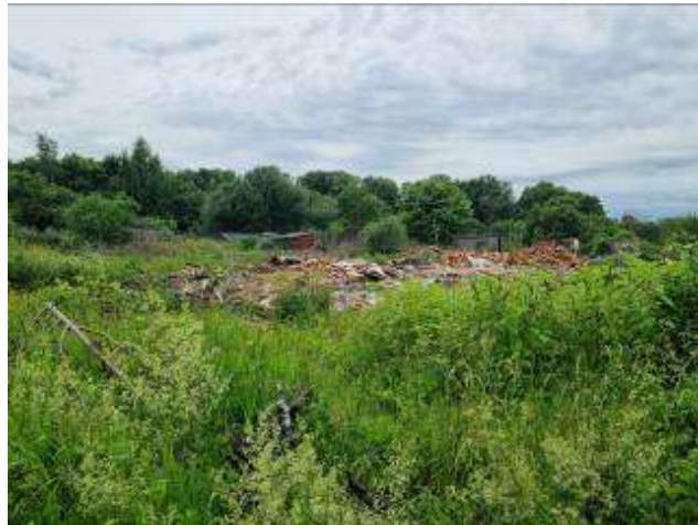
д. Городец, ул. Заречная, д.1