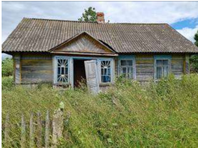
д. Иваново, ул. Центральная, д.25