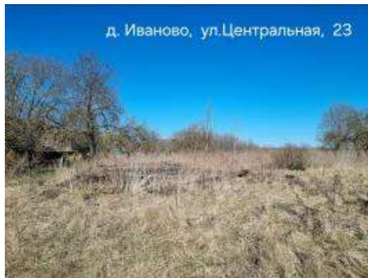
д. Иваново, ул. Центральная, 23