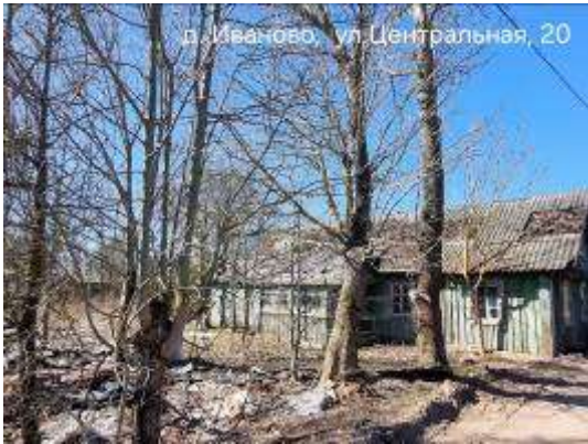
д. Иваново, ул. Центральная, 20