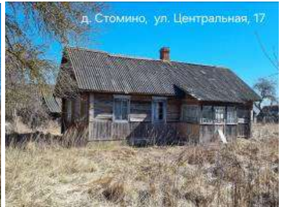
д. Стомино, ул. Центральная, 17